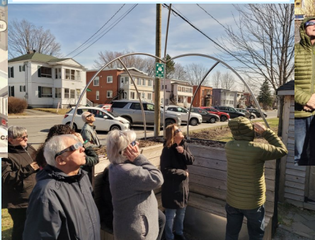
Éclipse solaire ! Le conseil d'administration en pleine action.

LA PAROLE EST À VOUS ! FAITES RESPECTER VOS DROITS